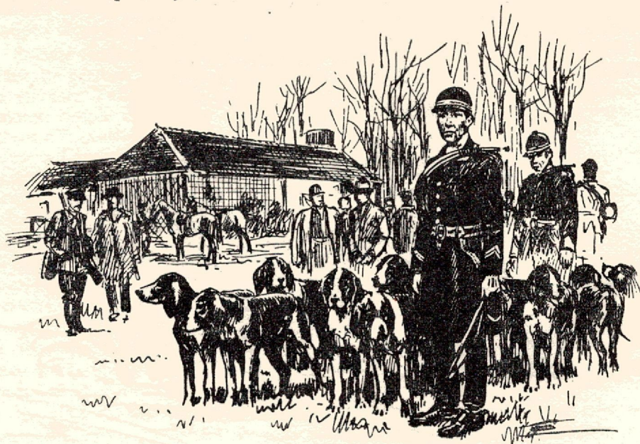
Vol ce l'Est et la meute